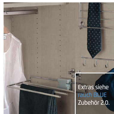
Extras siehe rauch BLUE Zubehör 2.0.