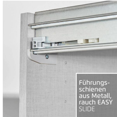
Führungsschienen aus Metall, rauch EASY SLIDE