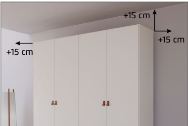
Für die Montage des Schrankes wird folgender Platz benötigt: Schrankhöhe + mind. 15 cm, Schrankbreite + mind. je 15 cm an beiden Seiten.