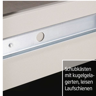
Schubkästen mit kugelgelagerten, leisen Laufschienen