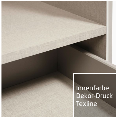
Innenfarbe Dekor-Druck Texline